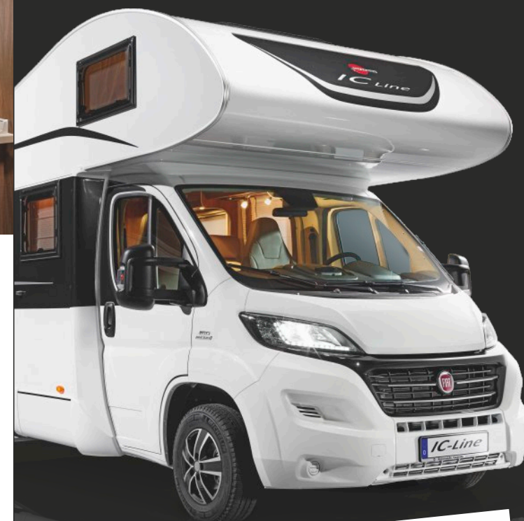
ARGOS TIME A 670 G IC-LINE

10% KUNDEN-RABATT für Besitzer eines Wagens aus dem Autohaus Becker-Tiemann Leinetal